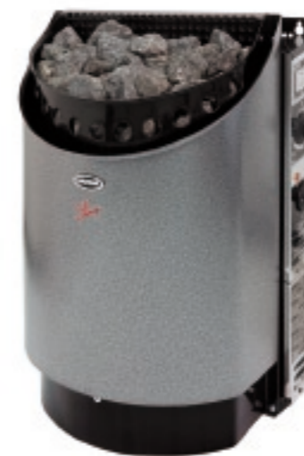
antiikin hopea (NAH)