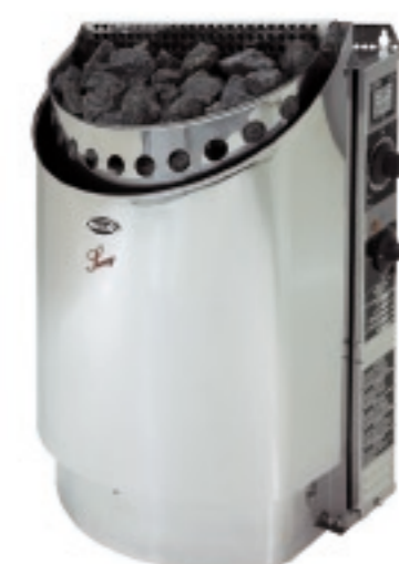
ruostumaton teräs (NR)

Sunny 12560NAH/12560NR 6 kW ja 12575NAH/12575NR 8 kW