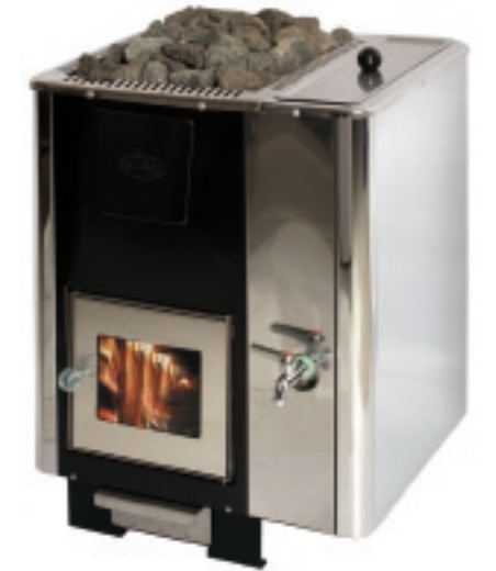
11206 + 17200

Vesisäiliö toimitetaan omassa pakkauksessaan, joka sisältää tarvittavat osat ja asennusohjeet. Säiliö voidaan asentaa kiukaan oikealle tai vasemmalle sivulle tai samanaikaisesti molemmille sivuille. Itse säiliöelementti jää tyylikkästi kiukaan ulkokuoren alle piiloon.