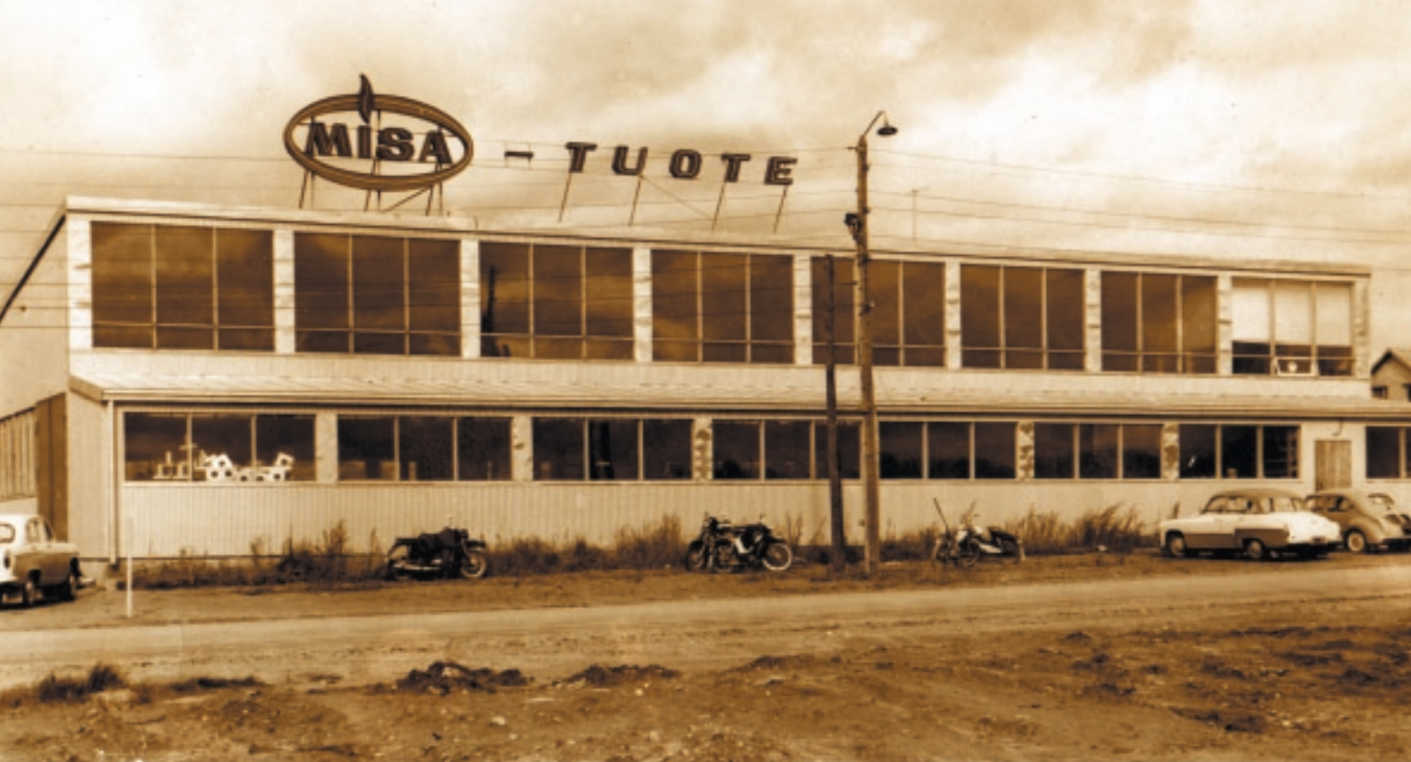
Misan tehdas Lappeenrannan Ratakadulla vuosina 1962–1966.